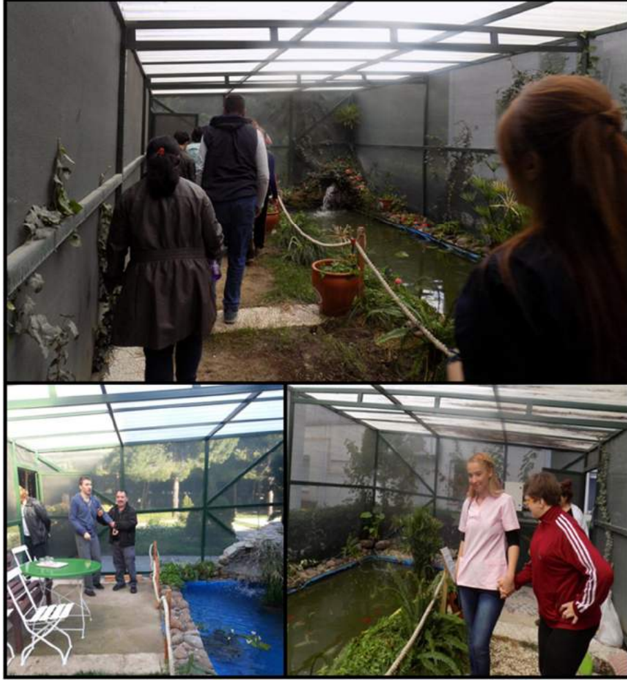
ekil 7. Ss havuzu.

Merkezin bahçesine yapılan ss havuzu byk ilgi grm ve gerek hastaların gerekse personelin en ok vakit geirdiėi yerlerden biri olmutur (ekil 7).