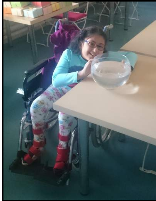
Şekil 5. Balık ve çocuk.

Su dünyası temalı düzenlemelerin yapıldığı salona ilginin oldukça yüksek olduğu ve tedavi için merkeze gelen çocukların ailelerinin yanı sıra merkezde staj yapan Ege Üniversitesi Atatürk Sağlık Hizmetleri Meslek Yüksek Okulu öğrencilerinin de yoğun ilgi gösterdikleri gözlenmiştir. Özellikle içerisinde balık olan fanusların engelli çocuklar tarafından sahiplenildiği ve hatta çocukların bu balıklara sevdikleri isimleri verdikleri de görülmüştür (Şekil 5).