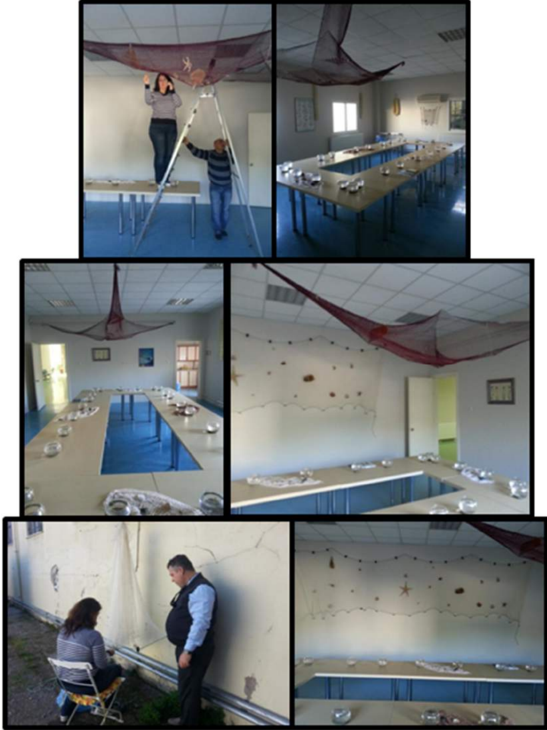
Şekil 1. Salonun su dünyası temalı düzenlenmesi.