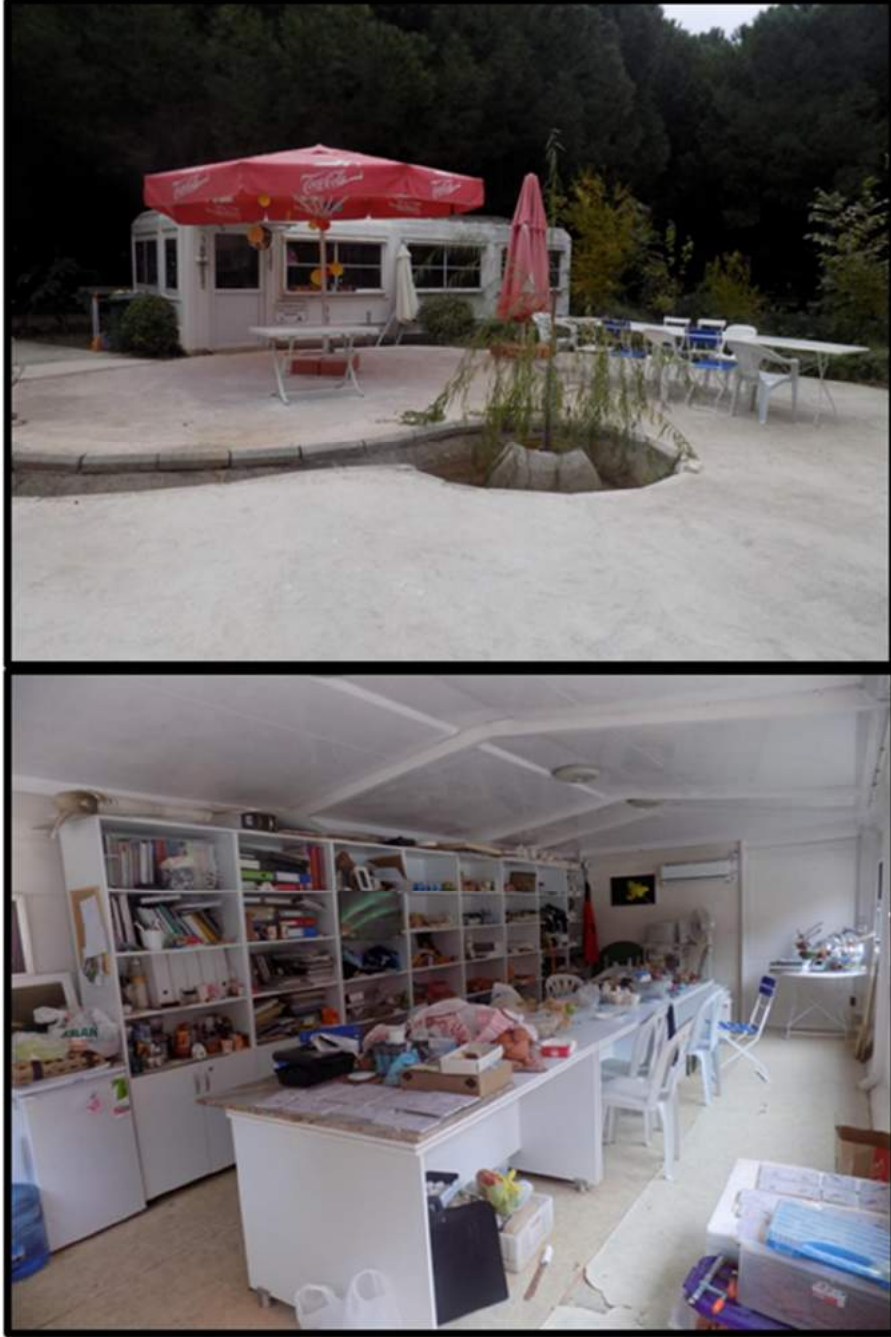
Şekil 4. Seramik Atölyesi.

Merkezin bahçesinde bulunan ve İzmir Büyük Şehir Belediyesi'nin tahsis ettiği bir konteynır düzenlenerek seramik ve el işi atölyesi oluşturulmuştur (Şekil 4). Seramik çalışmaları bu alanda yapılmıştır. Boyama çalışmaları merkez bina içerisinde bulunan iş-uğraşı atölyesinde yapılmıştır. Gerekli malzemeler satın alma yoluyla temin edilmiştir.