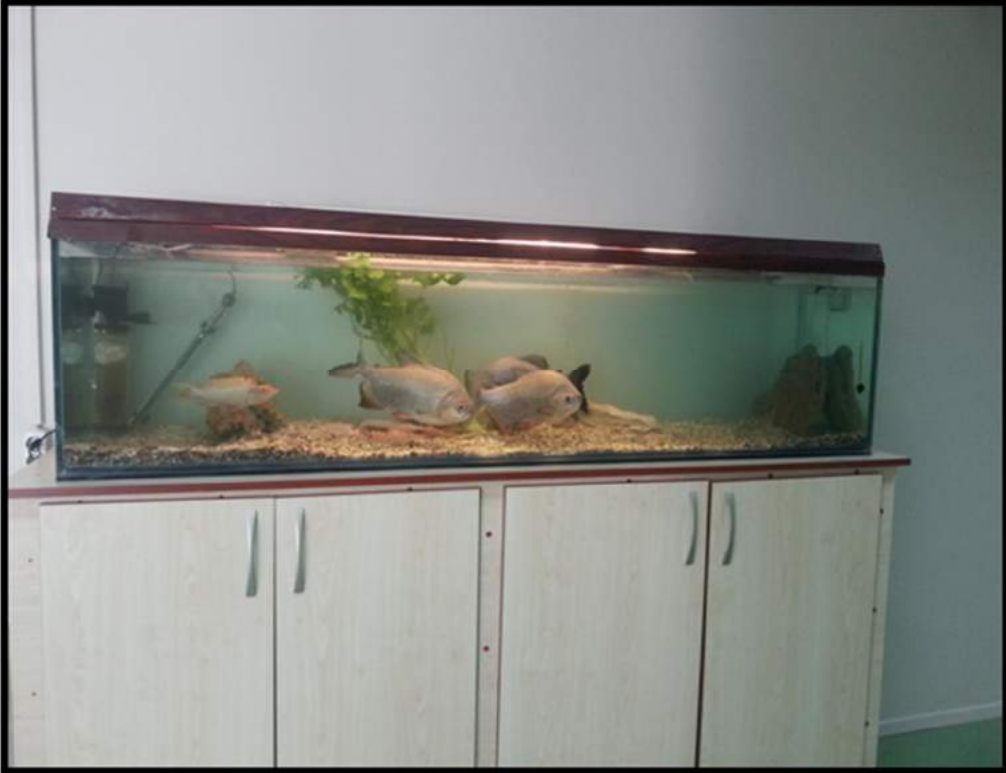
Şekil 2. Büyük akvaryum.