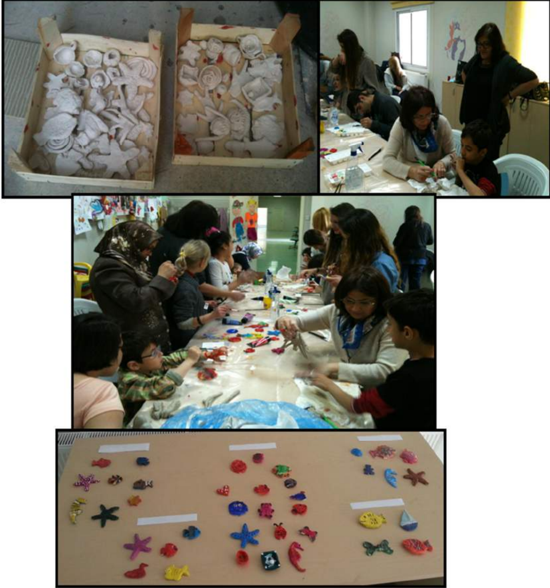
Şekil 8. Seramik çalışmaları.

Merkezin bahçesindeki seramik atölyesi haline getirilen konteynırda hazırlanan seramikler, merkez binası içerisinde bulunan iş-uğraşı atölyesinde boyanmıştır. Seramik ve boyama atölyesi çalışmalarına katılımın oldukça yüksek olduğu gözlenmiştir (Şekil 8).