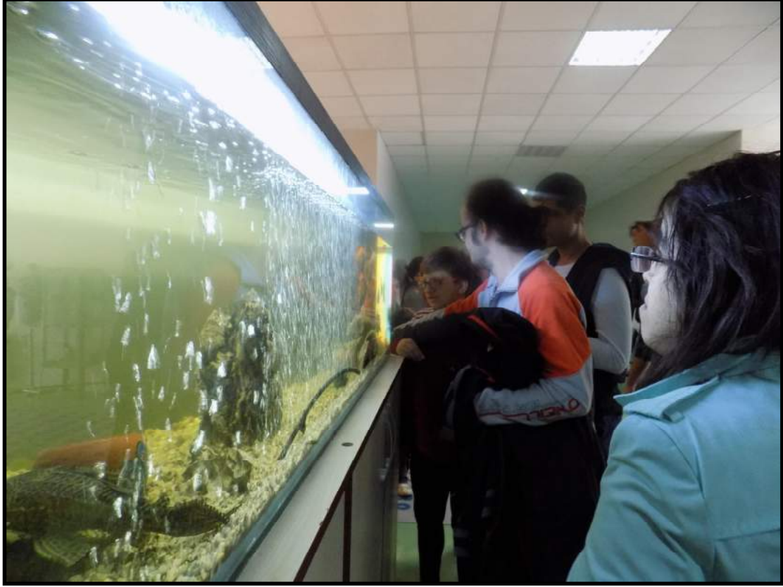
Şekil 6. Büyük akvaryum.

Merkezde kurulan büyük akvaryum, tedavi için bekleyen ya da tedavi arasında olan hastalar ve aileleri için vakit geçirmenin güzel bir yolu olmuştur (Şekil 6).