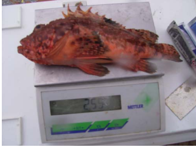
Şekil 10. Balıklarda ağırlık ölçümü