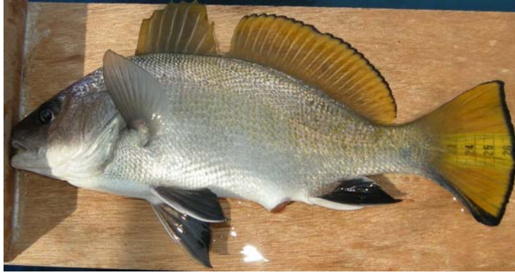
Şekil 3. Eşkına ( Sciena umbra )

Markalama çalışmalarında kullanılan 2 ayrı marka modeli proje materyalinde yer almaktadır (Şekil 4.)