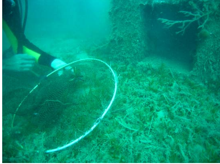
Şekil 7. Eşkinaların kepçe yardımıyla yakalanması.

Kepçe yardımıyla yakalanan örnekler hava keselerinin birdenbire genişmemesi amacıyla balıkadamlar tarafından yavaş bir şekilde yüzeye ulaştırılmıştır. Tekneye alınan örnekler deniz suyu ile aynı sıcaklıktaki tanklara alınmıştır.