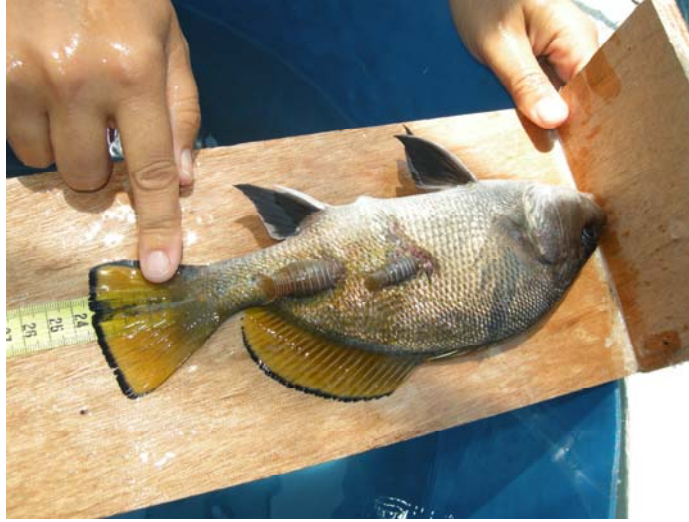
Şekil 9. Balıklarda boy ölçümü

Anestezi uygulanan balıklarda boy ağırlık ölçümleri 1mm hassasiyetli cetvel ile alınmıştır.Şekil 9, 10