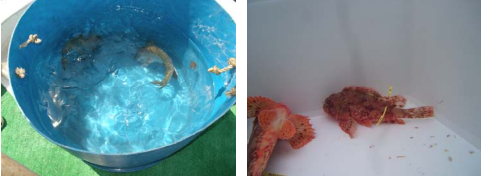
Şekil 8. Balıklarla anestezi uygulaması