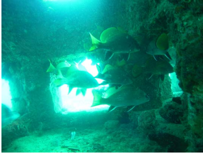
Şekil 6. Yapay resif bloğu içinde Eşkina balıkları.

Çalışmada geleneksel balıkçılık yöntemleri, balıkların canlı ve zarar vermeden yakalanabilmesi açısından kullanılamamıştır. Örneklemelede balık adamlar kepçeler yardımıyla örnekleri yapay resif bloğunun içinden avlamıştır.(Şekil 6. 7)