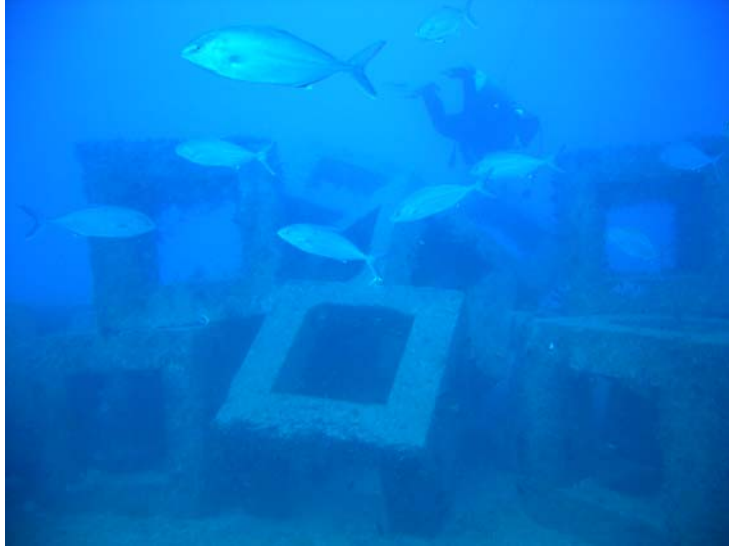
řekil 1Yapay resif alanı

Proje alıřmaları 1998 yılında gmldr kıyılarında 16-21m derinlik konturuna yerleřtirilen kbik ve beřgen kubbe řekilli resif kmelerinde yrtlmřtir.(řekil 1.)