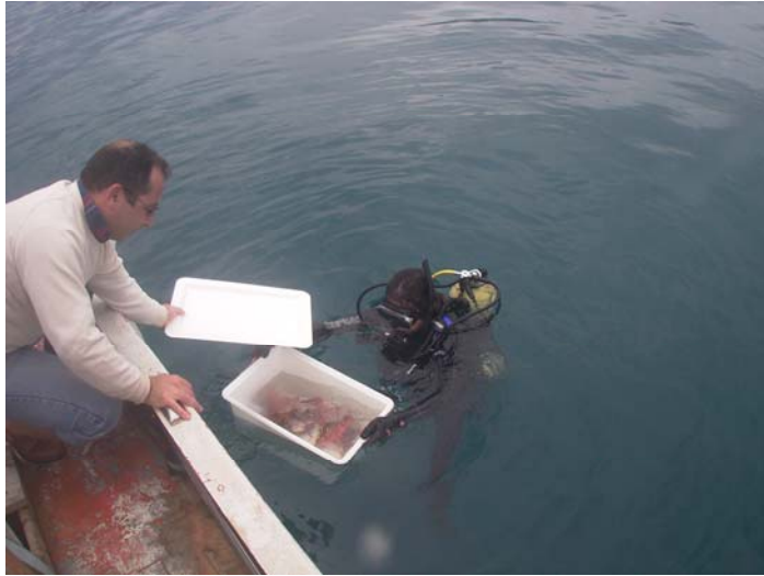
Şekil 13. Markalanan balıkların denize salınması

Markalanan balıklar balıkadamlar yardımıyla sualtına bırakılmıştır (Şekil 13.14).