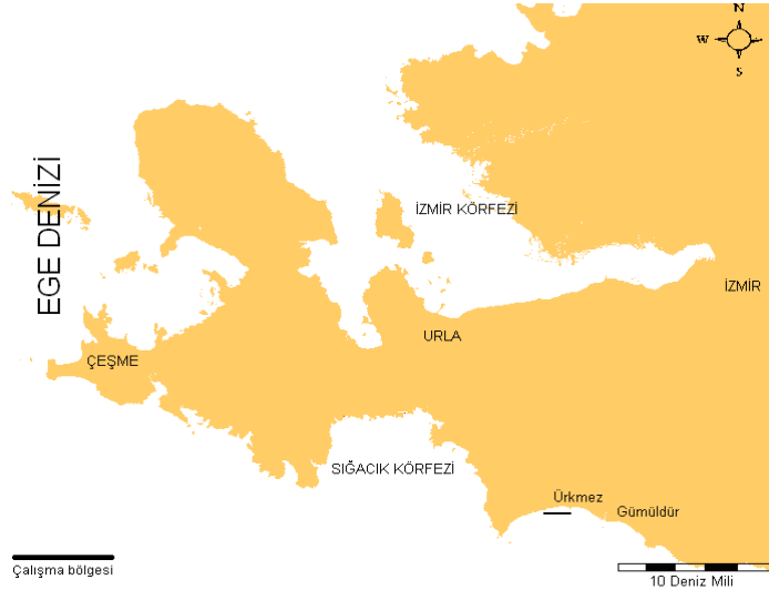
Şekil 5 Çalışma bölgesi

Çalışma Kuşadası körfezinin kuzeyinde yer alan Ürkmez-Gümöldür kıyılarında yürütülmüştür. (Şekil 5)