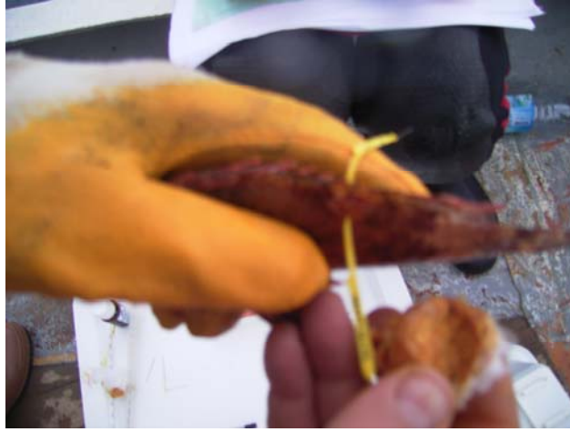
Şekil 11. İskorpit balığında markalama

Balıklar 2 farklı marka ile dorsal yüzgecin hemen altındaki kas bölümünden markalanmış, markalama sırasında steril iğne ve antibiotik kullanılmıştır (Şekil 10.11).