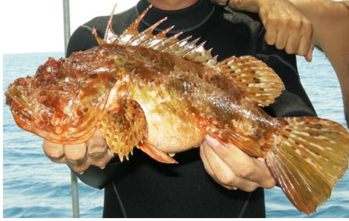
Şekil 2. İskorpit ( Scorpaena scrofa )