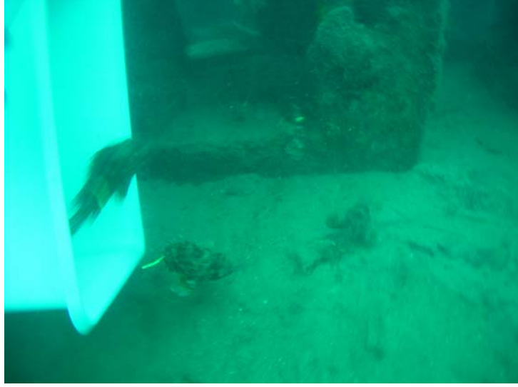
Şekil 14. Markalanan balıkların yapay resif alanına bırakılması