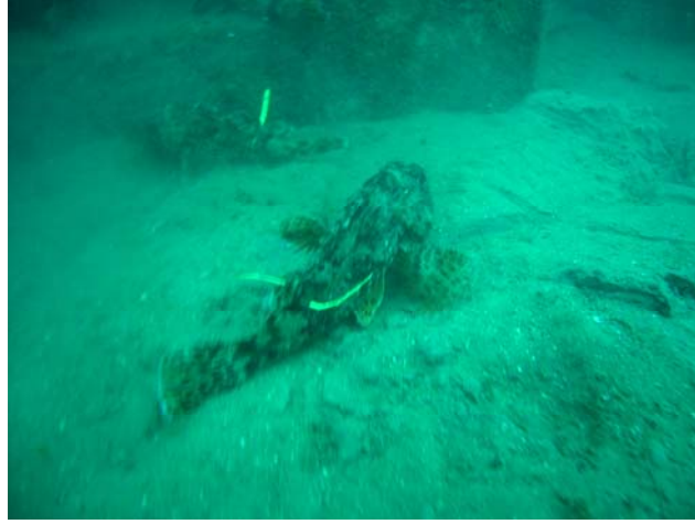
Şekil 15. Yapay resiflerde gözlenen markalı iskorpit balığı.

Yapay resif alanına bırakılan markalı balıklar donanımlı dalışlar ile gerçekleştirilen görsel sayım yöntemi, video ve fotoğraf makinası kayıtları ile izlemeye alınmıştır. Yapay resif kümelerinde günün 12:00-13:00 saatleri arasında 30 dakikalık dalışlar yapılmıştır. Gözlenen balıklar sualtı yazı bloğuna kaydedilmiş, ve balıkların sualtı fotoğrafları çekilmiştir (Şekil 15).