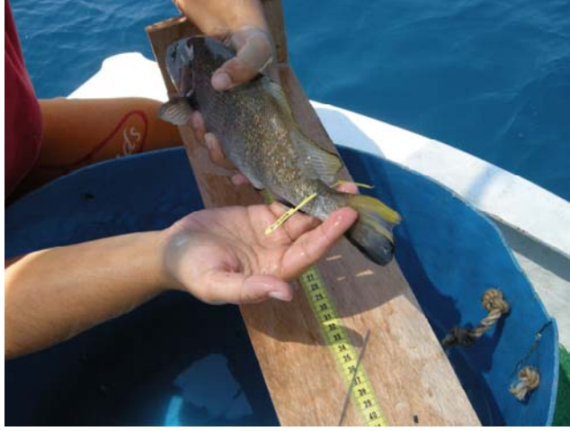
Şekil 12. Eşkına balığında markalama