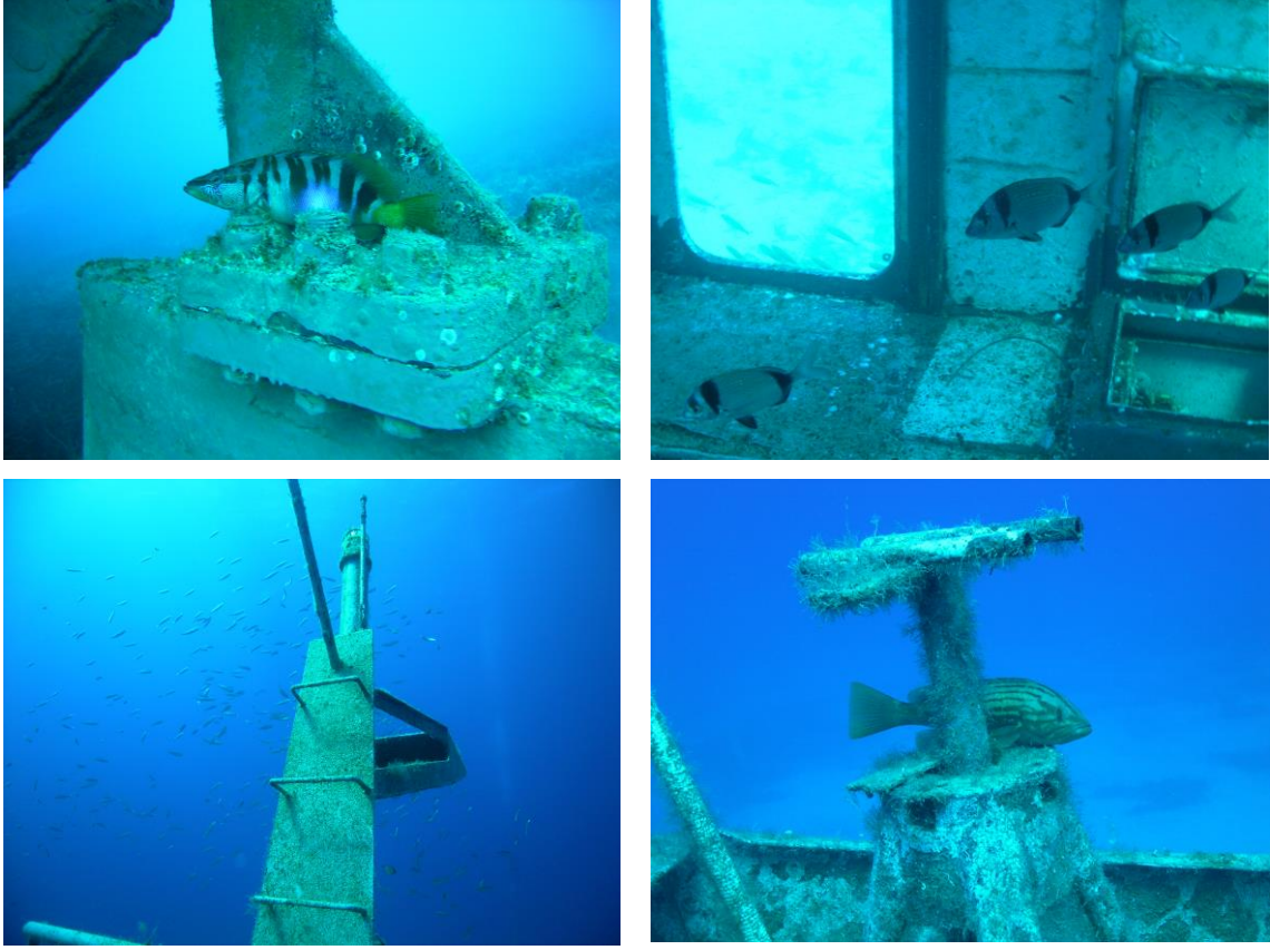
Şekil 4 Bazı balık türlerinin batıklar üzerinde konumlanma tercihleri