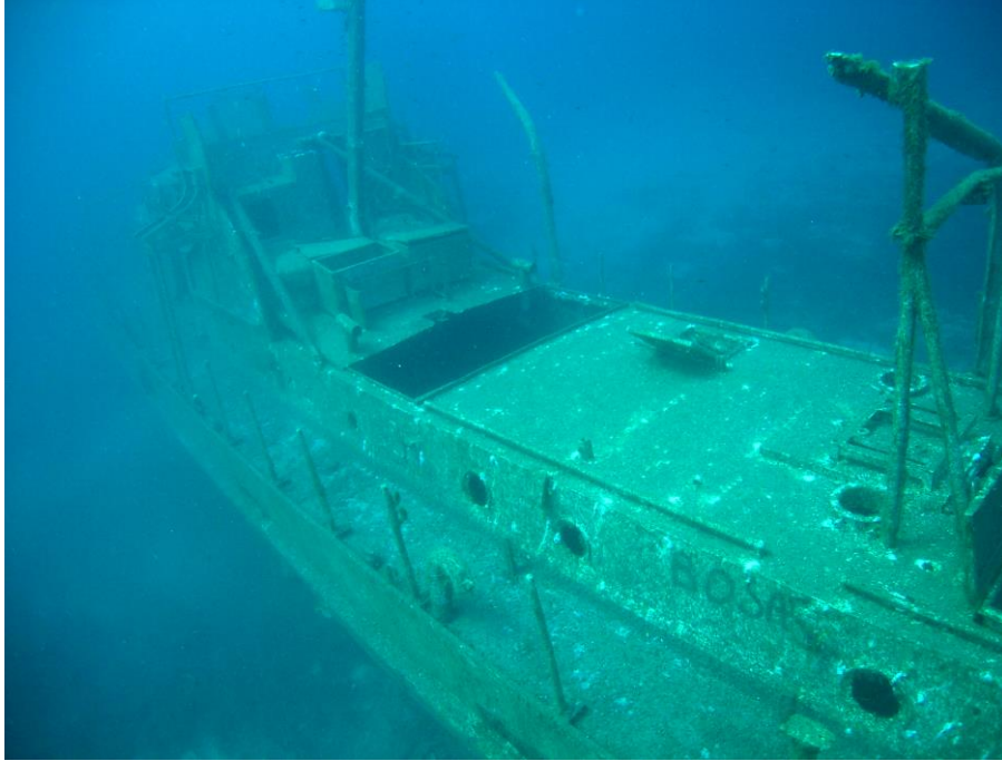
Şekil 1 . SG 115'in sualtında görünümü

SG 115, eski bir sahil güvenlik gemisi olup, boyu 29 metredir. 2007 yılının Mayıs ayı içerisinde, Bodrum Sualtı Araştırmaları Derneđi tarafından Karaada civarında batırılmıştır. Gemi 21 ile 29 metre arasında uzanmaktadır. Bölge zemini deniz çayırıları ile kaplıdır (Şekil1)